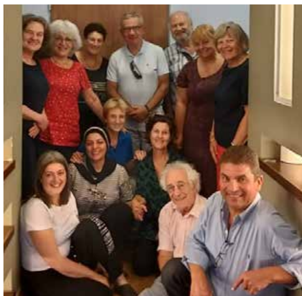
De delegatie uit Nederland bezoekt het hulpcentrum in Kfar Kana